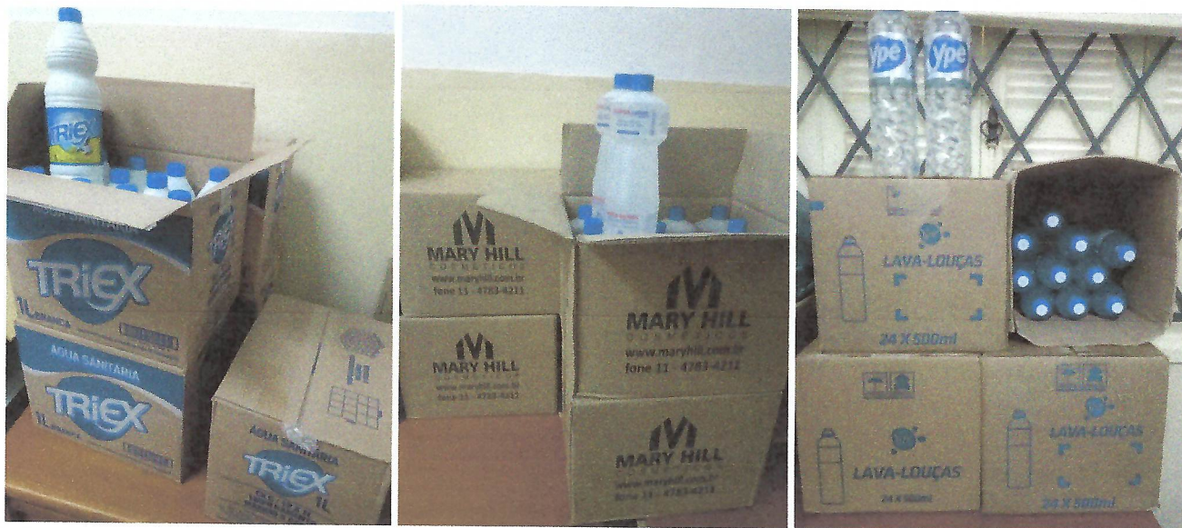
Taubaté-SP 03/05/2022 Foto das caixas de água sanitária, álcool 70% e detergente neutro adquiridas com o recurso da Emenda Parlamentar, no almoxarifado da Casa da Criança.