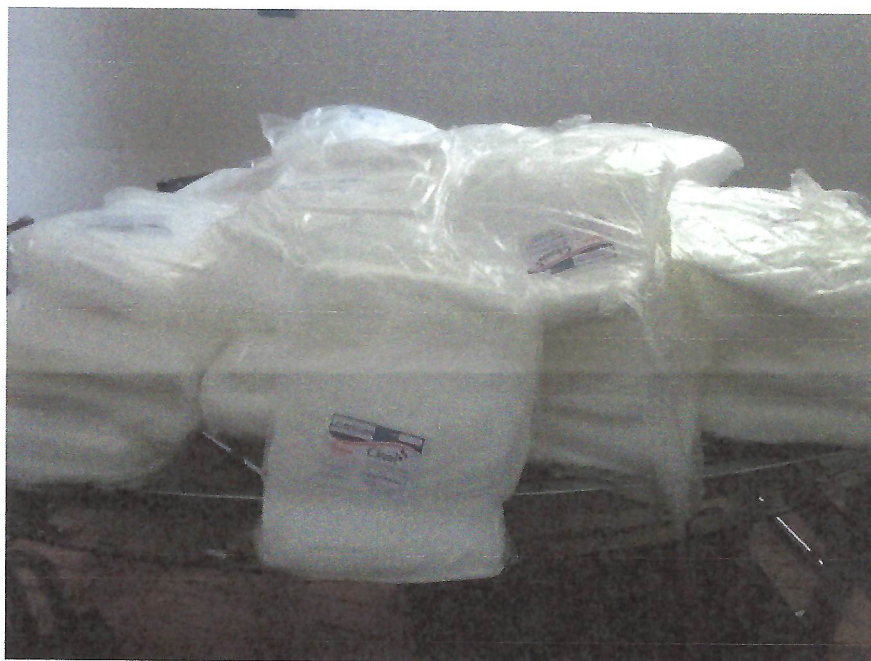
Taubaté-SP 04/05/2022 Foto dos pacotes de sapatilhas propé adquiridas com o recurso da Emenda Parlamentar, no almoxarifado da Casa da Criança para dispensação ao laboratório.